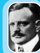
JEAN SIBELIUS ( 1865-1957 ) Compositor